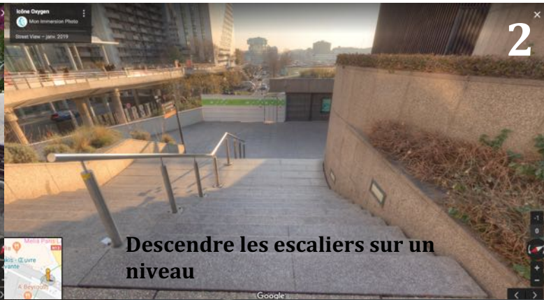
Descendre les escaliers sur un niveau