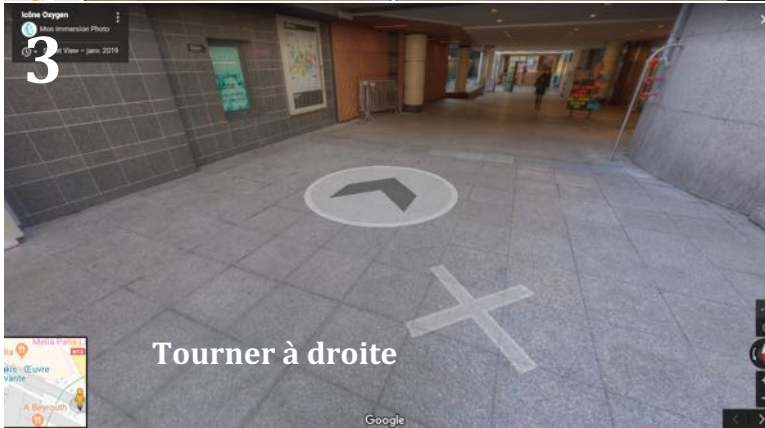
Tourner à droite