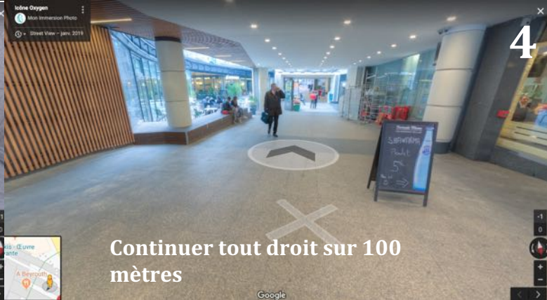
Continuer tout droit sur 100 mètres