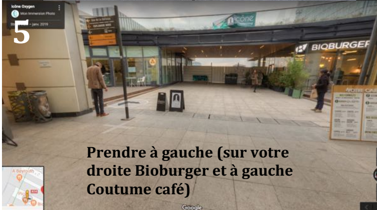
Prendre à gauche (sur votre droite Bioburger et à gauche Coutume café)