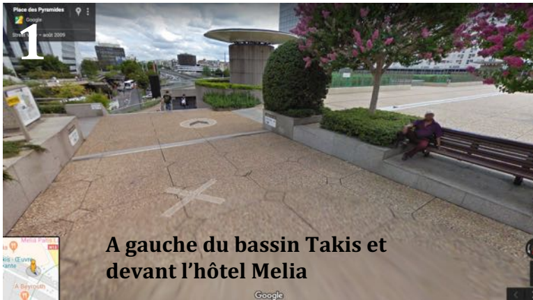
A gauche du bassin Takis et devant l'hôtel Melia