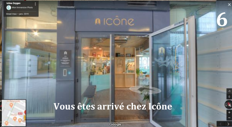
Vous êtes arrivé chez Icône